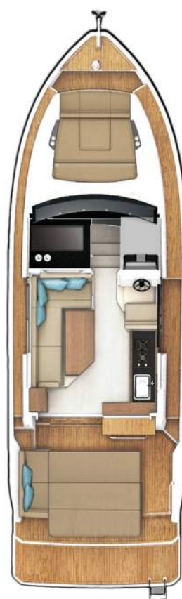
MAIN DECK optional with cockpit table to be transformed into sunpad and extended bathing platform