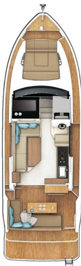
MAIN DECK optional with fixed cockpit table and extended bathing platform