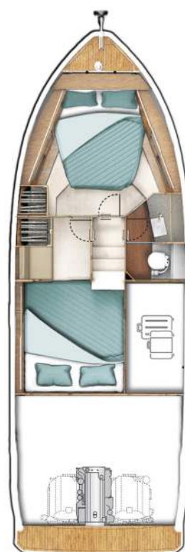
LOWER DECK standard